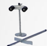
Travas de freio e volante