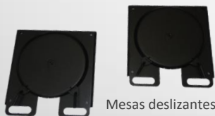
Mesas deslizantes dianteiras